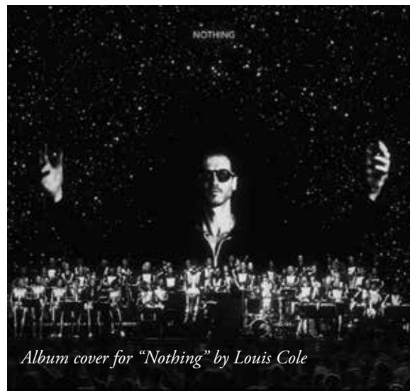
Album cover for "Nothing" by Louis Cole